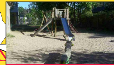
Herthastraße neben der Schule

1 Buddelkiste, 1 Rutsche, 1 Klettergerüst, 1 Drehmuschel, 2 Schaukeln, 1 Federwippe