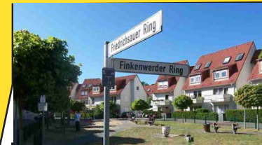
Friedrichsauer Ring/ Finkenwerder Ring