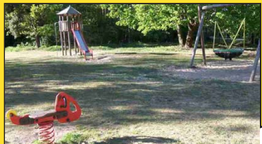
Birkenwerder Weg, Höhe Sandornweg, „Waldspielplatz“